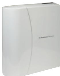
Abb. 2: BacTerminator® Booster2