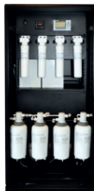
Abb. 3: BacTerminator® Mega Booster

BacTerminator® Mega Booster wird gemäß EN ISO 13485 hergestellt.