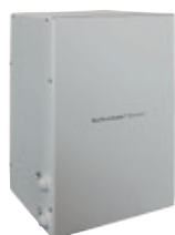
Abb. 1: BacTerminator® Booster1

BacTerminator® Booster Module dienen dazu, wasserbehandlungssystemen wie dem BacTerminator® Dental zusätzliche Kapazitäten hinzuzufügen. Auf diese Weise können solche Geräte als zentrale Wasserbehandlungssysteme verwendet werden. Dies ermöglicht beim Spitzendurchfluss eine höhere Kapazität, auch wenn mehrere zahnärztliche Behandlungsgeräte an ein einziges BacTerminator® Dental angeschlossen sind. BacTerminator® Booster wird gemäß EN ISO 13485 hergestellt.